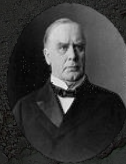
McKinley amerikai elnök (1901)