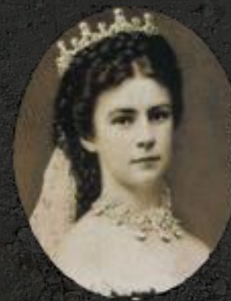
„Sissi” osztrák császárné, magyar királyné (1898)