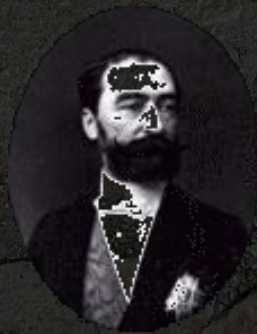
Carnot francia elnök (1894)