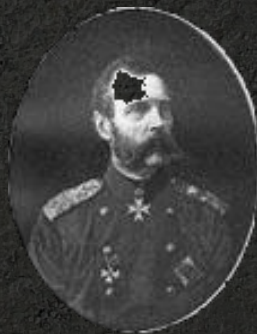
II. Sándor cár (1881)